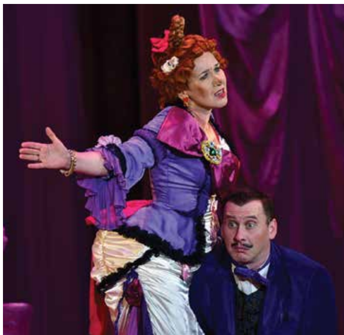
17 листопада 2021 року. Проня — заслужена артистка України Ірина Беспалова-Примак, Свирид Голохвостий — заслужений артист України Максим Булгаков

складових закулісної роботи. Репетиційний процес йшов легко, на одному диханні. В повітрі витав «дух» комедії, утримання якого в просторі вимагало неабиякої майстерності, а з відтворення абсурдних та безглузких ситуацій сюжету і виходило саме те сценічне дійство, яке називається комедією».