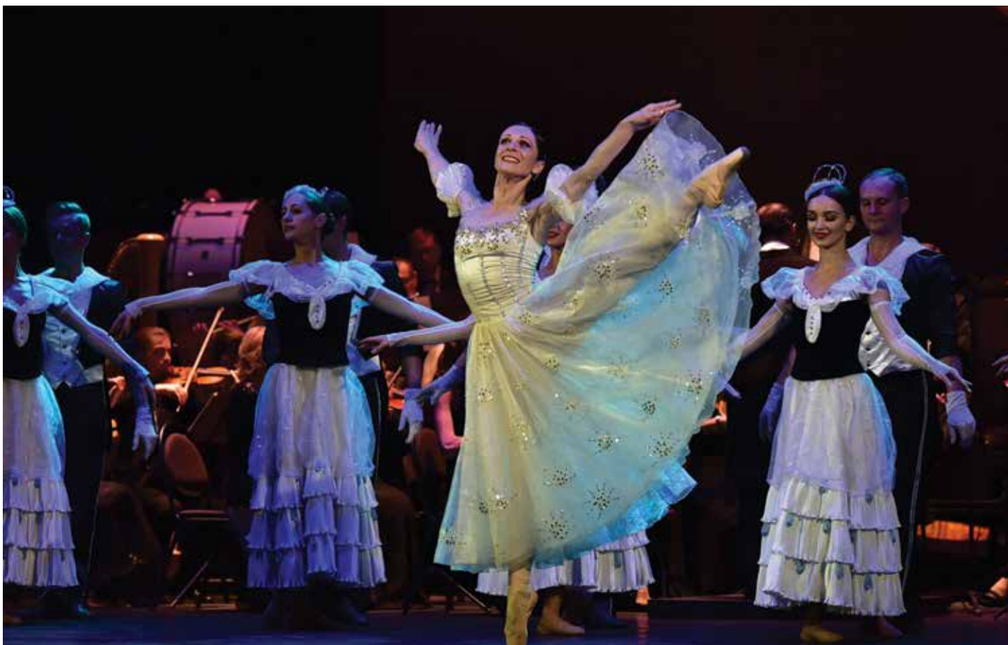
На сцені заслужена артистка України Юлія Ільченко