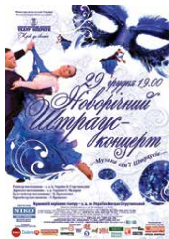
2012 рік. Афіша концерту