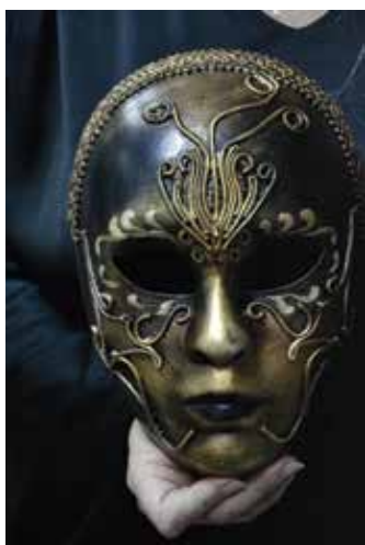
Маска Катарини Кавальєрі