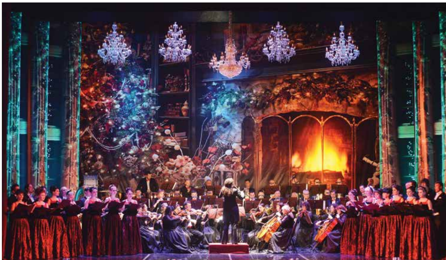
2014 рік. Концерт «Штраус в опереті»