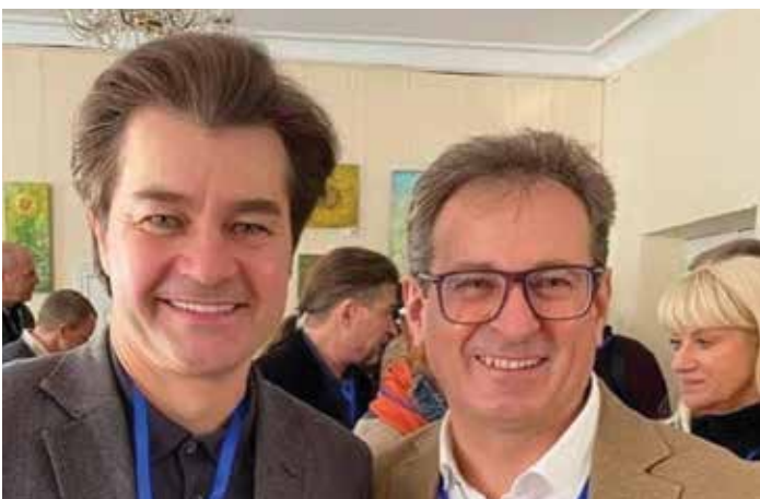
Народні артисти України Євген Нищук та Богдан Струтинський

Генеральний директор-художній керівник Національної оперети України, голова НСТДУ Богдан Струтинський, директор Чернігівського обласного академічного українського музично-драматичного театру ім.Т.Г. Шевченка, голова міжобласного відділення НСТДУ Сергій Мойсієнко, генеральний директор-художній керівник Івано-Франківського національного академічного драматичного театру імені Івана Франка, заступник голови НСТДУ, керівник напряму регіональної політики Ростислав Держипільський