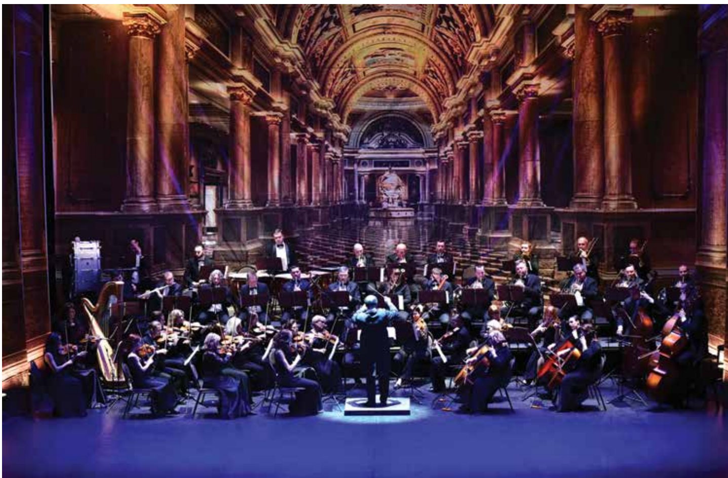
На сцені симфонічний оркестр Національної оперети України під керівництвом заслуженого діяча мистецтв України Сергія Дідка

Новини / News / Новини / News / Новини / News