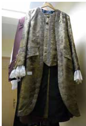
Костюм австрійського імператора Йосифа II