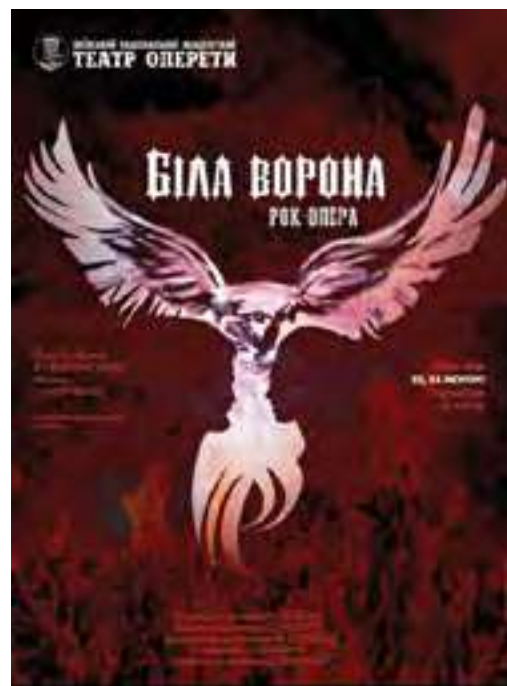
Валерія Лазебнюк. II курс. КУК

Переглянути виставку можна в Арт-фойє театру на 2-му поверсі з 4 лютого 2019 року до 23 лютого 2019 року