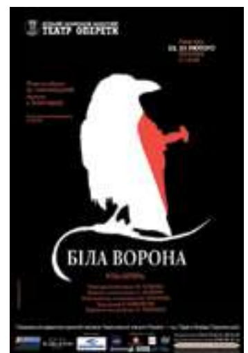
Павло Корнійчук. IV курс. КУК