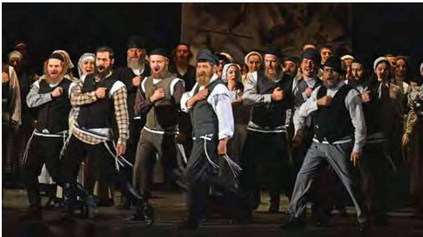
Сцена з вистави «Скрипаль на даху». Тев'є-молочник – народний артист України Микола Бутковський

кроків і бачення. Так, наприклад, аби розуміти сучасне покоління, у яких, на мій погляд, кліпове сприйняття дійсності, запрошую на вистави своїх вже дорослих дітей. Мені важливо знати, як вони сприймають виставу, що їм подобається, що – ні. Проходять роки та проблема поколінь залишається незмінною.