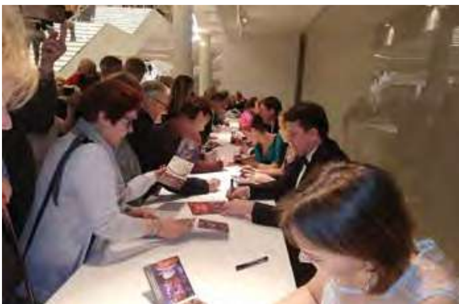
Перед початком концерту в ICE Kraków Congress Centre