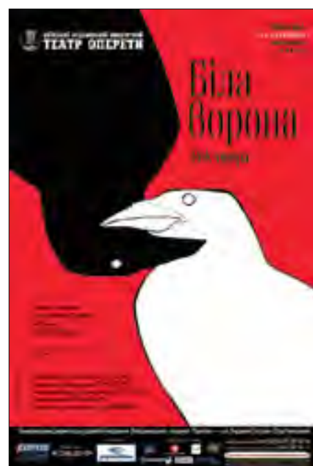
Поліна Бордюже. I курс. КНУКіМ

пересічної особистості і соціуму. Участь у конкурсі стала idée fixe для багатьох, без огляду на поточний курс і практичний досвід. Підсумки творчого змагання не можуть не радувати. Початок закладено, далі буде! 📣