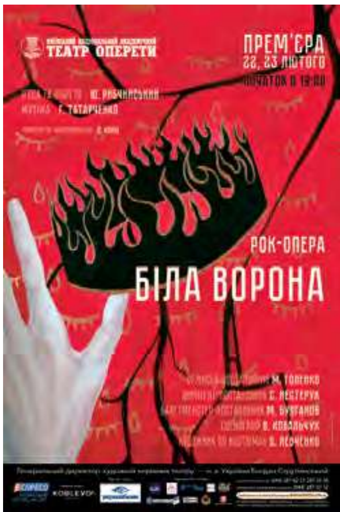
Анастасія Воропаєва. IV курс. КНУКіМ